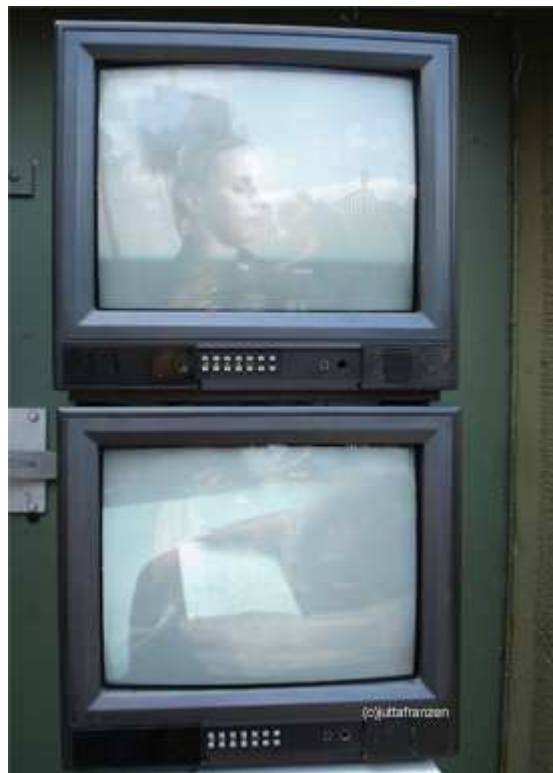
Elvira Hufschmid Private Portraits