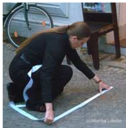
© Monika Lilleike | Berlin 2008

Eine Bildtafel des französischen Mathematikers Desargues zeigt 7 , wie man Fäden am darzustellenden Ding befestigt, zwischen die Finger klemmt, zu Linien strafft und vor dem