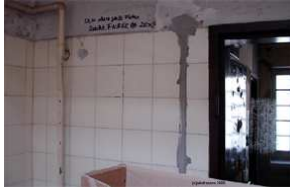
Kaaren Beckhof Kolam Latrinalia

Das Toilettenhaus als ein besonderer Ort weist in seinem Inneren eine eigene Textur aus Linien auf, die den engen Raum durchziehen –architektonische Elemente wie Gitter, Abflussrinnen, Fliesenfugen sowie Zeichnungen und Sprüche – Latrinalia - die sich mit dem Schmutz und der Struktur der Wände verbinden. Das Kolam greift die Frage eines der Latrinalia „Ich- wann?“- auf und unterstreicht so die zeitliche Vergänglichkeit des Ortes und der eingreifenden Aktion. Ist die Bewegung des Streuens, die die Linien des Kolams zieht, beendet, so beginnen die Linien wieder zu verschwinden: durch das Verwischen beim Überschreiten, durch das Austrocknen in der Sonne oder das Verwehen im Windzug. Die Unendlichkeit der Linie verblasst in der endlichen Zeit ihres Bestehens.