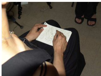
Elvira Hufschmid Private Portraits