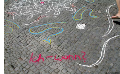
Kaaren Beckhof Kolam Latrinalia

Das Toilettenhaus als ein besonderer Ort weist in seinem Inneren eine eigene Textur aus Linien auf, die den engen Raum durchziehen –architektonische Elemente wie Gitter, Abflussrinnen, Fliesenfugen sowie Zeichnungen und Sprüche – Latrinalia - die sich mit dem Schmutz und der Struktur der Wände verbinden. Das Kolam greift die Frage eines der Latrinalia -„Ich- wann?“- auf und unterstreicht so die zeitliche Vergänglichkeit des Ortes und der eingreifenden Aktion. Ist die Bewegung des Streuens, die die Linien des Kolams zieht, beendet, so beginnen die Linien wieder zu verschwinden: durch das Verwischen beim Überschreiten, durch das Austrocknen in der Sonne oder das Verwehen im Windzug. Die Unendlichkeit der Linie verblasst in der der endlichen Zeit ihres Bestehens.